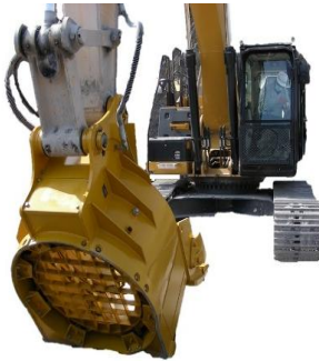
網固定式 クイックふるい

WQF70 WQF45 0.7m 3 用 0.45m 3 用 標準価格 ¥5,450,000 標準価格 ¥4,719,000