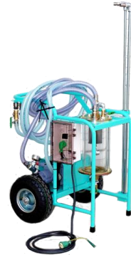
オイルタンククリーナー