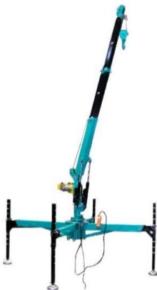
組立式クレーン どこでもつる太郎

SPH45F3 SPH60F5 SPH70F5 41Kg 60Kg 67Kg 標準価格 ¥311,000 標準価格 387,000 標準価格 ¥451,000