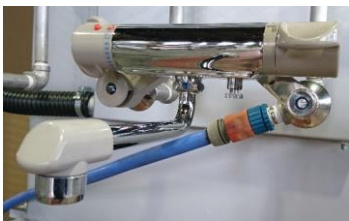
冷温水混合栓(オプション)※2