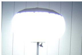
上カバー反射タイプも あります