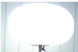
点灯時のソフトな光